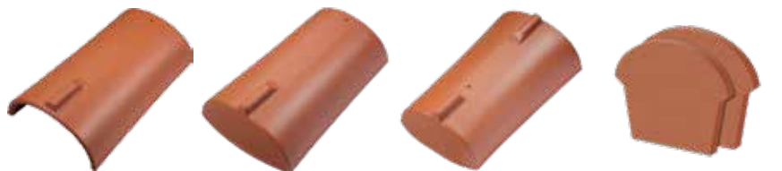
Rygning F1v Rygningsstart F1v Rygnings Slut F1v F1v endeskiver start/slut