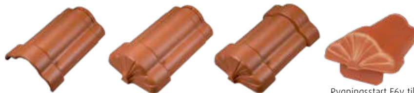
Rygning F6v Rygningsstart F6v Rygnings Slut F6v Rygningsstart F6v til vindskedesten