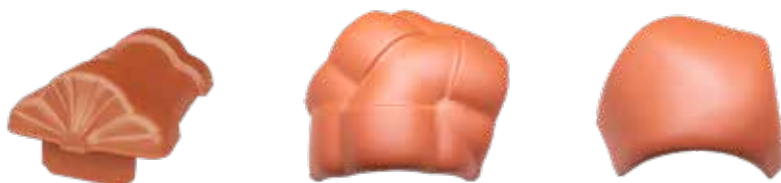
Rygnings Slut F6v til vindskedesten Walmkappe Special F6v Walmkappe F1v/F16