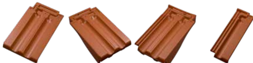
Dobbeltvinge Vindskedesten venstre Vindskedesten højre Halve tegl