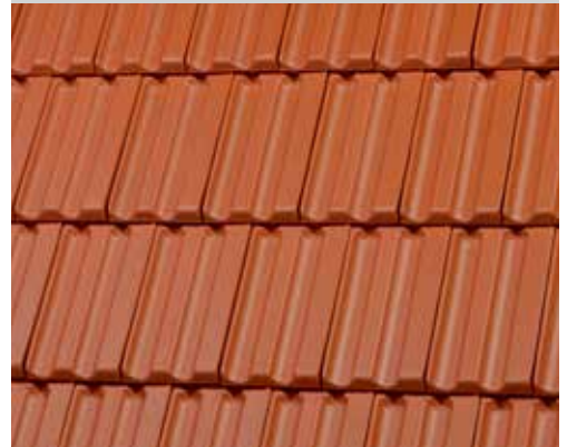
Flade: Gammelrød, Tagbillede i forbandt