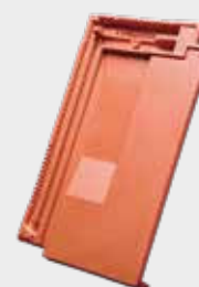
Udluftningssten til tagrum