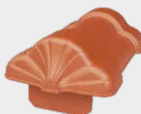
Rygnings Slut F6v til vindskedesten