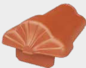
Rygningsstart F6v til vindskedesten