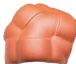
Walmkappe special F6v