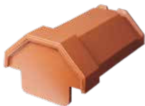
Rygningsstart F21 til vindskedesten