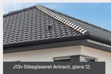
J13v Silkeglaseret Antracit, glans 12.