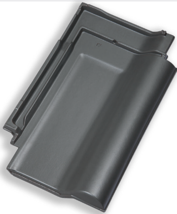
J13v Silkeglaseret Antracit, glans 12

NYHED J13v Silkeglaseret Vulkansort, glans 16