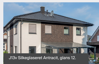
J13v Silkeglaseret Antracit, glans 12.