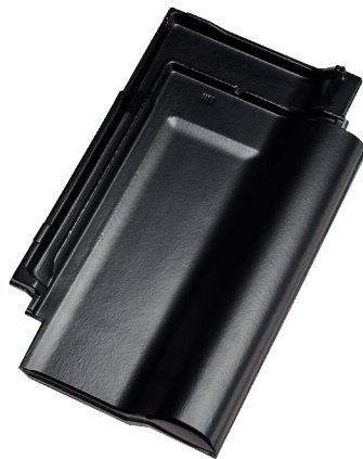
J13v Silkeglaseret NYHED Vulkansort, glans 16

Med Jacobis flade falstagsten J13v, Silkeglaseret Vulkansort, undgår man refleksion som en højglans overflade afgiver og man får samme fordele som ved en glaseret overflade i både hårdhed og styrke.